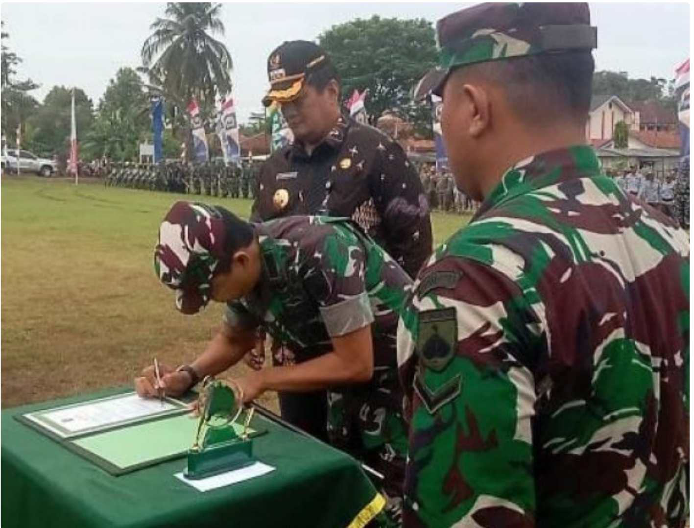
TMMD Kodim 0703/Cilacap di Desa Bojong, Jembatan Percepatan Pembangunan dan Pemberdayaan Masyarakat

CILACAP - TMMD Sengkuyung Tahap I Kodim 0703/Cilacap tahun 2025 di Desa Bojong, Kecamatan Kawunganten, Kabupaten Cilacap telah resmi dibuka oleh Pj. Bupati Cilacap M. Arif Irwanto.